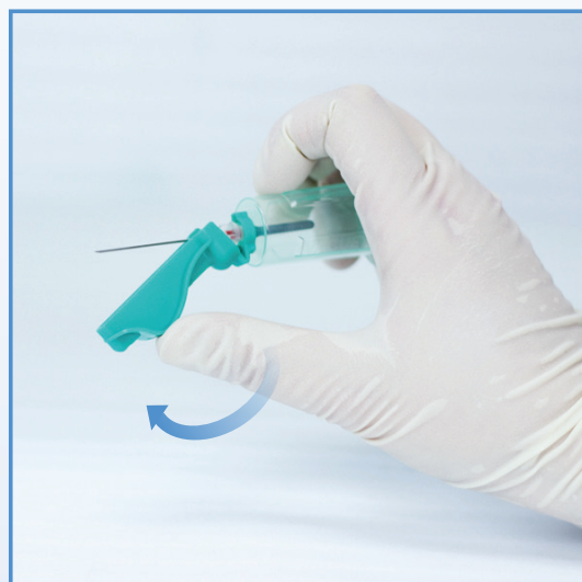
6 Aktivera säkerhetsmekanismen med ett finger.