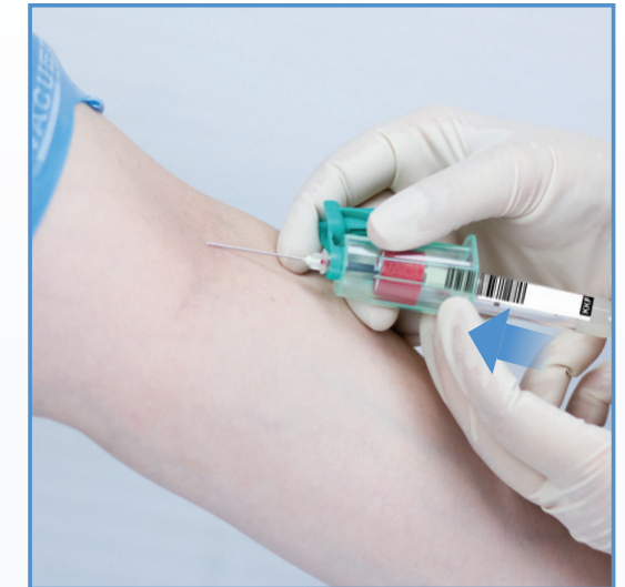
4 Sätt i röret.