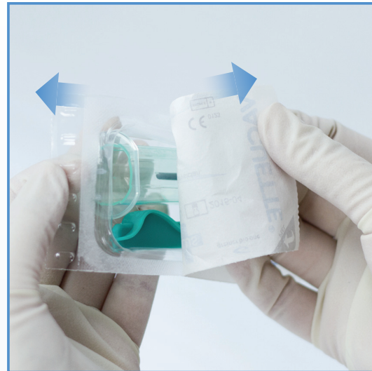
1 Öppna förpackningen enligt anvisning.