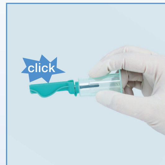
7 Ett hörbart klick bekräftar aktivering.