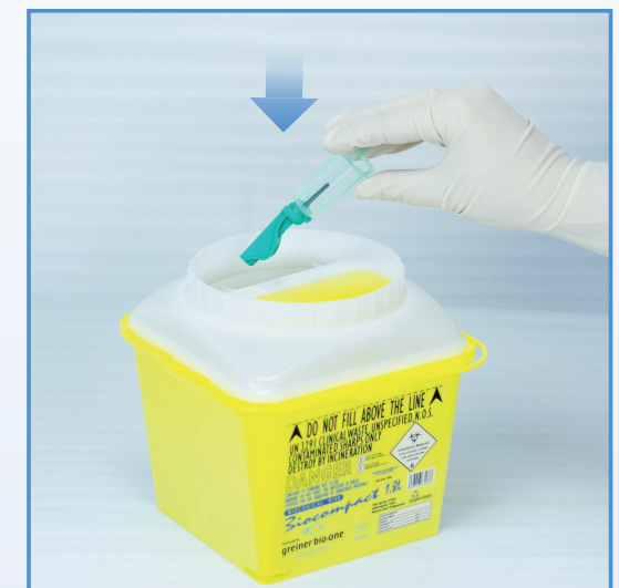
8 Kasta hela provtagningssetet i avfallsbehållaren.